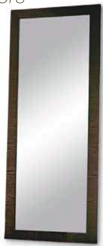
ANDROS* ANDROS* L. 720 x P. 60 x H. 1880