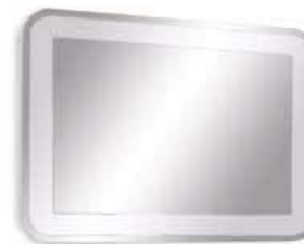
SIRIO rettangolare acidata SIRIO rectangular frosted L. 1060 x P. 24 x H. 800