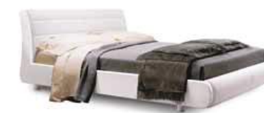
LettoLINEA Bed LINEA

90 - L. 979 x P. 2179 x H. 950 120 - L. 1279 x P. 2179 x H. 950 160 - L. 1679 x P. 2179 x H. 950 180 - L. 1874 x P. 2179 x H. 950