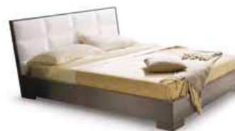
LettoVEGA Bed VEGA

160 - L. 1679 x P. 2144 x H. 970 180 - L. 1874 x P. 2144 x H. 970