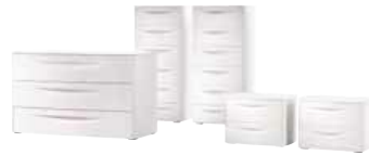
26 Collection MITO