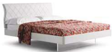
LettoDIVA c/gamba plex e luce Bed DIVA w/gambaplex and light

90 - L. 979 x P. 2144 x H. 970 120 - L. 1279 x P. 2144 x H. 970 160 - L. 1679 x P. 2144 x H. 970 180 - L. 1874 x P. 2144 x H. 970 200 - L. 2074 x P. 2144 x H. 970