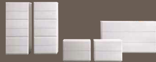
SETTIMANILE DIAMANTE 6 CASSETTI TALLBOY 6 DRAWERS cod. 106EVB L. 548 x H. 1244 x P. 520

Rovere a poro aperto laccato Bianco, Argilla, Canapa, Visone, Piombo MELAMINE ASH EFFECT OPEN PORE MATT LACQUERED BIANCO, ARGILLA, CANAPA, VISONE, PIOMBO