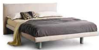
LettoSTYLE c/ring strutturale Bed STYLE with structural ring

Disponibile anche con ring: bombato Also available with rounded ring