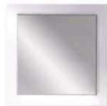
ZENIT quadrata vetro fuso ZENIT squared molten glass L. 800 x P. 22 x H. 880