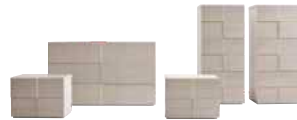
62 Collection DAMA