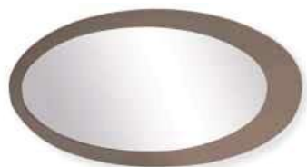
POLAR** POLAR** L. 1200 x P. 22 x H. 640