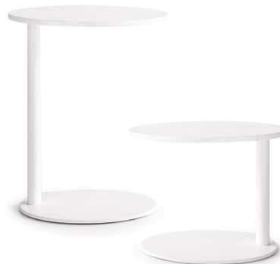
Tavolino ELLISSE laccato bianco opaco brunch table "ellisse" matt bianco L. 565 x P. 435 x H. 490 L. 565 x P. 435 x H. 700