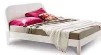
LettoGIOVE Bed GIOVE

90 - L. 979 x P. 2144 x H. 988 120 - L. 1279 x P. 2144 x H. 988 160 - L. 1679 x P. 2144 x H. 988 180 - L. 1874 x P. 2144 x H. 988