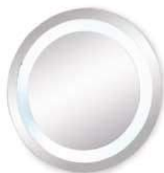
DISCO con luce DISCO with light Ø 900 x P. 50