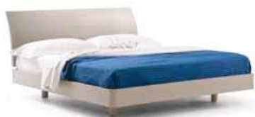
LettoCLEO Bed CLEO

160 - L. 1679 x P. 2172 x H. 950 180 - L. 1874 x P. 2172 x H. 950