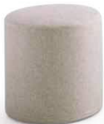
POUFF rotondo con piedini round pouff with feet Ø 400 x H. 400 Ø 400 x H. 480 Ø 550 x H. 400