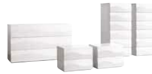
80 Collection ONDA