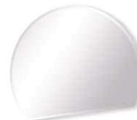
ORION ORION L. 1100 x P. 24 x H. 870