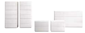
92 Collection DIAMANTE