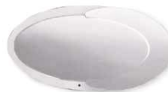
DIVA** con luce DIVA** with light L. 1220 x P. 40 x H. 640