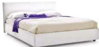
LettoSTYLE TRAPUNTATO c/ring people Quilted Bed STYLE with ring people

Disponibile anche con ring: bombato, soffio, strutturale Also available with rounded ring, Soffio and Structural