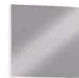
GALAXI GALAXI L. 500 x P. 25 x H. 500