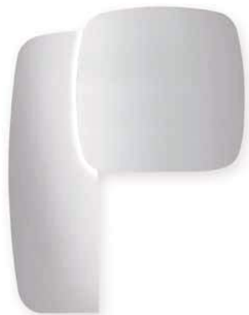
MITO intera con luce MITO whole with light L. 1340 x P. 42 x H. 1276