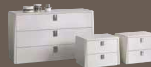
COMO ® PRISMA 3 CASSETTI CHEST OF 3 DRAWERS cod. 105ERD L. 1348 x H. 806 x P. 521