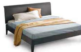
LettoSATURNO Bed SATURNO

160 - L. 1679 x P. 2144 x H. 970 180 - L. 1874 x P. 2144 x H. 970