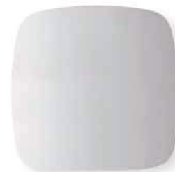
MITO con luce MITO with light L. 950 x P. 42 x H. 934