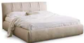
LettoGLAMOUR c/ring bombato Bed Glamour with rounded ring

90 - L. 991 x P. 2210 x H. 890 120 - L. 1291 x P. 2210 x H. 890 160 - L. 1691 x P. 2210 x H. 890 180 - L. 1886 x P. 2210 x H. 890 200 - L. 2086 x P. 2210 x H. 890