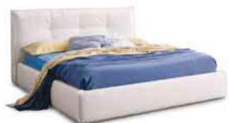
LettoTIME c/ring soffio Bed TIME with ring Soffio

Disponibile anche con ring: bombato, soffio, strutturale Also available with ring: rounded, soffio, structural