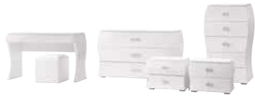
06 Collection DIVA