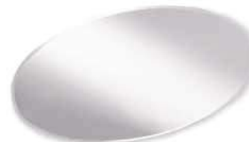
ASTRO ASTRO L. 1300 x P. 22 x H. 640