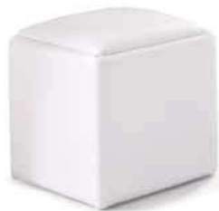
POUFF quadrato con ruote suaed pouff with swivel wheels L. 420 x P. 420 x H. 480