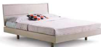
LettoDAMA Bed DAMA

90 - L. 979 x P. 2144 x H. 988 120 - L. 1279 x P. 2144 x H. 988 160 - L. 1679 x P. 2144 x H. 988 180 - L. 1874 x P. 2144 x H. 988