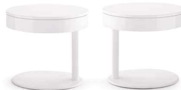
Tavolino ELLISSE c/cassetto laccato bianco opaco brunch table with drawer matt bianco L. 565 x P. 435 x H. 490