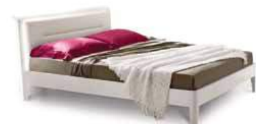
LettoIRIDE c/luce Bed IRIDE w/light

120 - L. 1330 x P. 2145 x H. 1032 160 - L. 1730 x P. 2145 x H. 1032