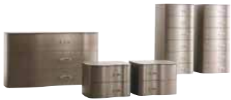
44 Collection LUX