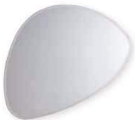
STONE con luce STONE with light L. 1050 x P. 22 x H. 880