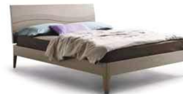
LettoONDA Bed ONDA

160 - L. 1785 x P. 2155 x H. 930 180 - L. 1965 x P. 2155 x H. 930