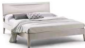
LettoMITO c/luce Bed MITO w/light

160 - L. 1679 x P. 2144 x H. 970 180 - L. 1874 x P. 2144 x H. 970