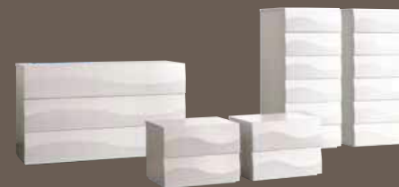
COMO' ONDA 3 CASSETTI CHEST OF 3 DRAWERS cod. 105ERC L. 1318 x H. 779 x P. 520