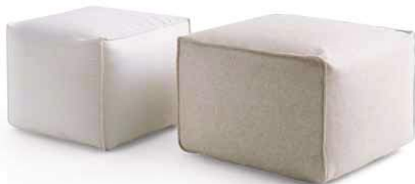
POUFF quadrato con piedini squared pouff with feet L. 400 x P. 400 x H. 400 L. 400 x P. 400 x H. 480 L. 550 x P. 550 x H. 400 L. 650 x P. 650 x H. 400