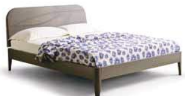
LettoLUX Bed LUX

90 - L. 991 x P. 2277 x H. 890 120 - L. 1291 x P. 2277 x H. 890 160 - L. 1691 x P. 2277 x H. 890 180 - L. 1886 x P. 2277 x H. 890 200 - L. 2086 x P. 2277 x H. 890