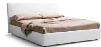
LettoSTYLE c/ring people Bed STYLE with ring People

Disponibile anche con ring: bombato, soffio, people Also available with ring: rounded, soffio, people