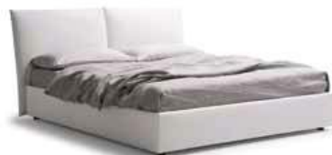
LettoSOFT c/ring people Bed SOFT with ring people

Disponibile anche con ring: soffio, people, strutturale Also available with ring: soffio, People, structural