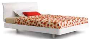
LettoDIVA LEGNO Bed DIVA legno

90 - L. 979 x P. 2144 x H. 970 120 - L. 1279 x P. 2144 x H. 970 160 - L. 1679 x P. 2144 x H. 970 180 - L. 1874 x P. 2144 x H. 970 200 - L. 2074 x P. 2144 x H. 970